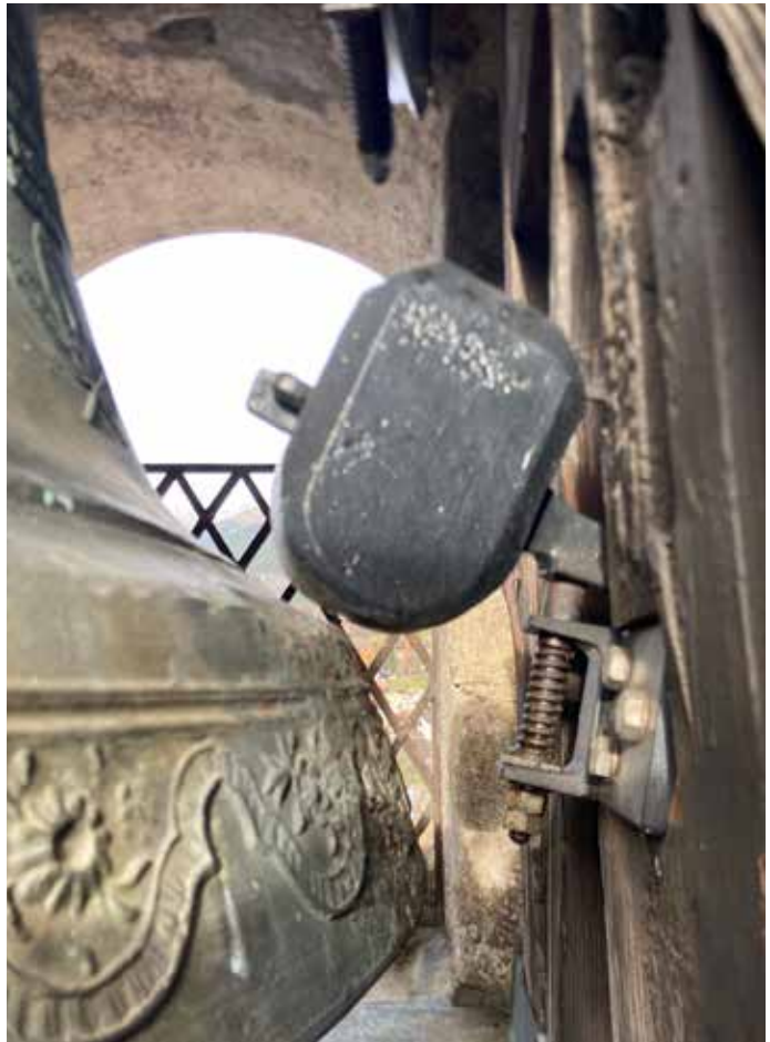
Schlägt die Glocke schneller, wirft es den «Zwölfischtai» aus der Bahn: Schlagwerk der Kirche Filisur.