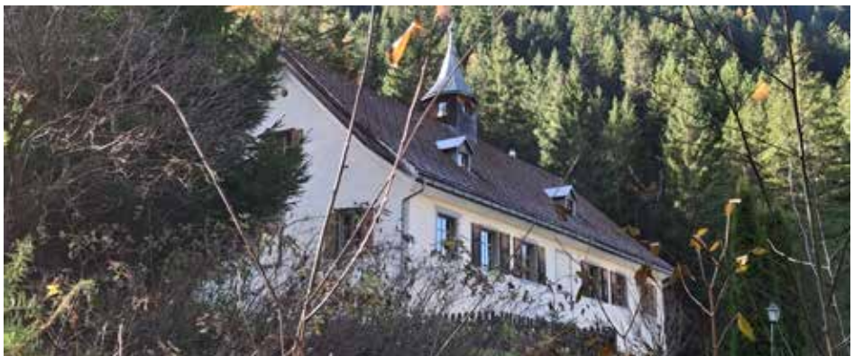
Immer wieder Schauplatz schrecklicher Ereignisse: das Gasthaus in Bellaluna.

Wann genau das Schmelzwerk in Bellaluna erbaut wurde, weiss man nicht. Man nimmt an, dass während einer ersten Bergbauperiode, die um 1550 begann, eine Schmelze in Filisur, unten an der Albula stand. Die Besitzer jener Anlagen waren die Herren Vertemati-Fran-