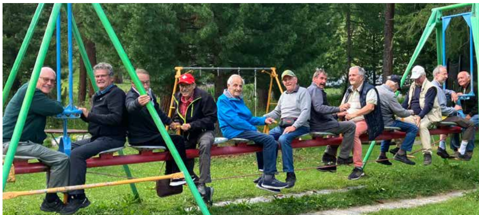
Vi da la pichalaida a Spinass as ho gust eir gnand vegl.

Ushè ho piglio il di sia fin e chi so che chi capita in ün an ?