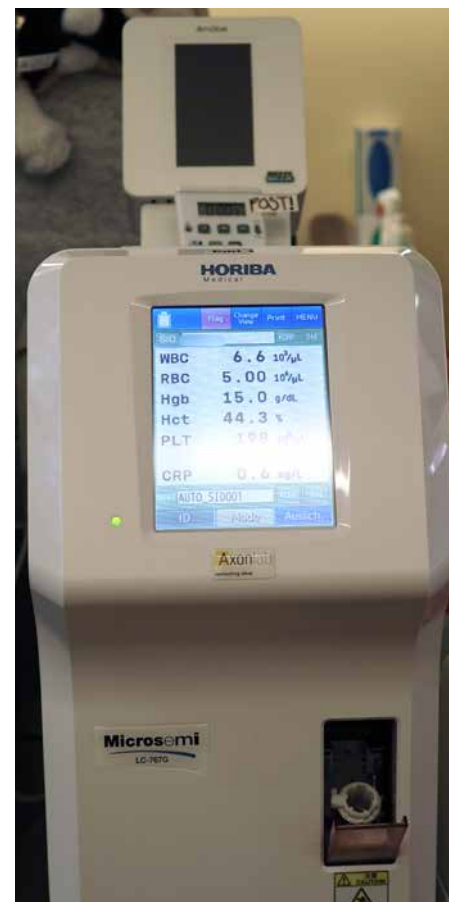
Damit die Maschine die Blutwerte zuverlässig misst, muss sie regelmässig gewartet werden.

Leistungserfassung nachführen, Zuweisungen fertigmachen, Unfallberichte für die Versicherung oder Begründungen für Medikamentenverschreibungen für die Krankenkassen schreiben. Derweil füllen die Medizinischen Praxisassistentinnen (MPAs) das Verbrauchsmaterial auf, reinigen und sterilisieren die Geräte, warten, spülen und eichen die Labormaschinen, warten die Röntgenmaschine und vieles mehr.