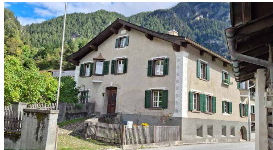
Das «Dokterhuus» in Filisur.

Sein ehemaliges Elternhaus und späteres Wohnhaus wird in Filisur bis heute «Dokterhuus» genannt. Die von 1931 an in Bergün praktizierenden Ärzte hielten bis um circa 1970 zweimal die Woche ihre Sprechstunde im «Dokterhuus» ab. Später fanden diese Sprechstunden im neu gebauten Gemeindehaus statt und wurden erst vor Kurzem während der Coronapandemie eingestellt.