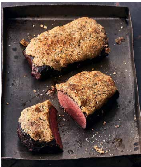
Rindsfilet mit Baumnusskruste.

Schweinsfilet, Lammrücken, Hirschfilet, Auberginen, Karotten, Geisskäse, Ofenkartoffeln, Birnen.