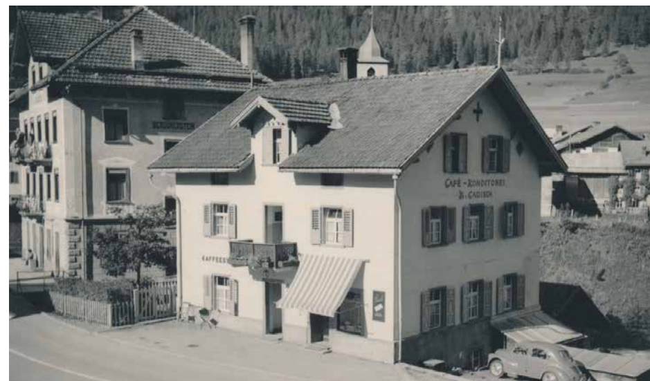
Bäckerei Cadisch um 1955, noch ohne den seitlichen Anbau von 1995.

Abenteuerlich müssen die Fahrten mit hochansteckenden Diphtherie-Patienten gewesen sein. «Der Arzt riet mir, während der ganzen Fahrt nach Thusis einfach den Kopf seitlich aus dem Fenster zu halten, um damit einer