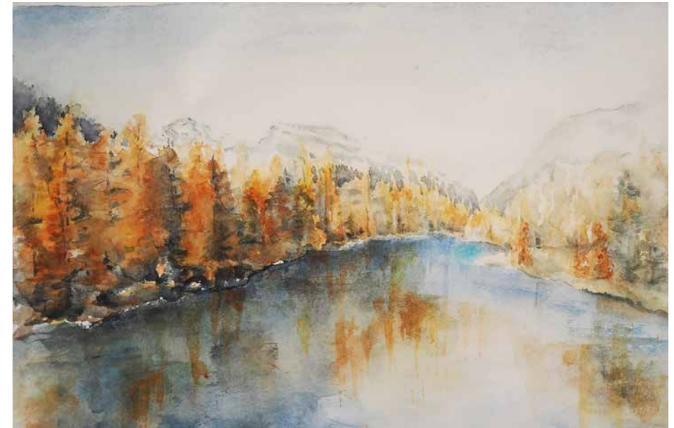
Igl Lai da Palpuegna igl uton · Der herbstliche Palpuognasee. (aquarel: Mirta C. Huder)