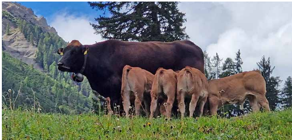
Was diese Ammenkuh wohl zum Vorgehen des Kleinen Rates gesagt hätte?